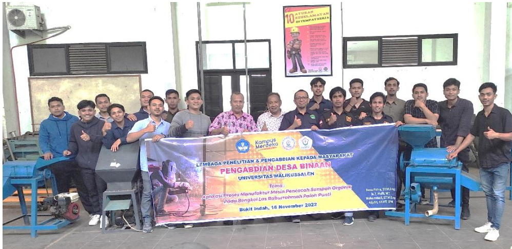
Gambar 4. Pelatihan Manufaktur di Laboratorium Teknik Mesin Unimal

Dampak positif dari Pengabdian ini terlihat dari antusiasme peserta yang merupakan Pemuda dilingkup Universitas Malikussaleh, tepatnya dari Desa Paloh Pundi. Dampak utamanya adalah proses transformasi ilmu dan ketrampilan dari Kampus ke Masyarakat lingkungan desa binaan. Dampak selanjutnya adalah terbukanya wawasan keteknikan dari Mitra dan mahasiswa yang terlibat dalam kegiatan pengabdian ini bahwa alih fungsi dari beberapa alat dapat diproses atau dibuat menjadi sebuah alat baru yang memiliki daya guna baru pula dan menyelesaikan dampak sampah organik yang sebelumnya hanya di bakar sehingga terbuang dengan percuma. Harapan dari Pimpinan Desa dan Pimpinan YPI Baburrahma berharap kedepannya, MoU dan IA yang telah dilakukan agar dapat terus dilanjutkan dan melalui menggandeng desa-desa binaan lainnya dalam mengimplementasikan ilmu pengetahuan walaupun dengan bidang ilmu yang berbeda-beda.