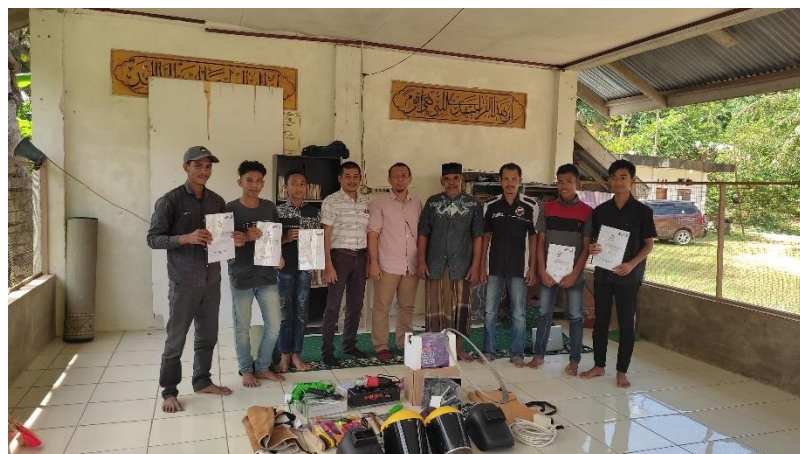
Gambar 1. Penyerahan Alat Bantu Las

Teknik pengabdian yang dilakukan kepada pemuda aktif di desa tersebut adalah dengan memperkenalkan teknik desain dan manufaktur sebagai dasar pembuatan mesin pencacah dengan menggunakan teknik ATM (Amati Tiru Modifikasi) dan dengan memanfaatkan barang-barang bekas untuk dapat dirakit dan buat sebuah mesin yang memiliki daya guna baru. Proses manufaktur adalah proses lengkap pengolahan bahan atau material yang dimulai dari bahan baku hingga menjadi sebuah produk yang dapat berfungsi sesuai dengan desainnya. Proses manufaktur ini di mulai dari mendesain atau menggambar alat yang telah sesuai dengan kaidah-kaidah permesinan. Sehingga secara teori gambar ini dapat dikerjakan / di manufakturing menjadi sebuah produk yang kompleks.